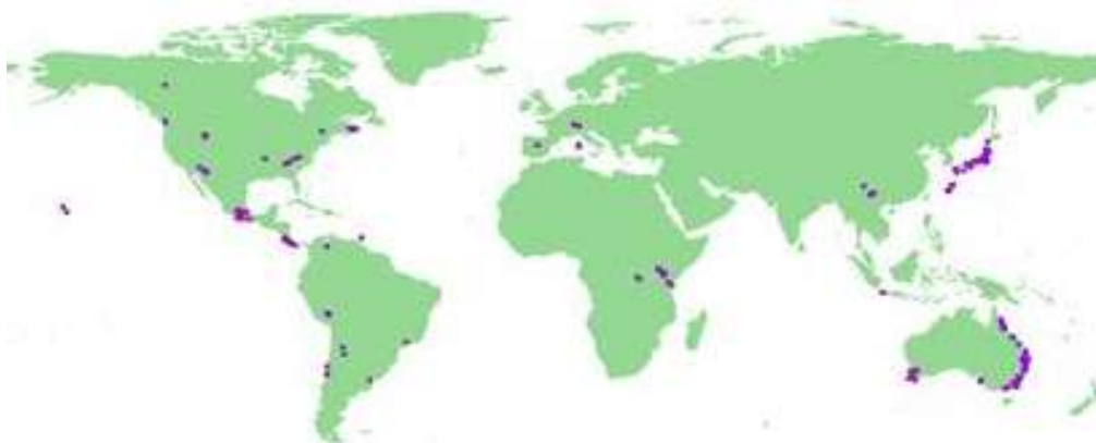
図1. 使用したカエルツボカビの在地点